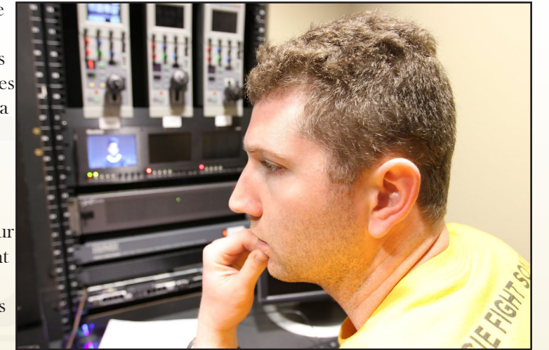
Sample caption for article image.

Ere res mo bea sit ad modis rera sequo et utaecus nempor atquos erum apitate mporeius remquas utempe.