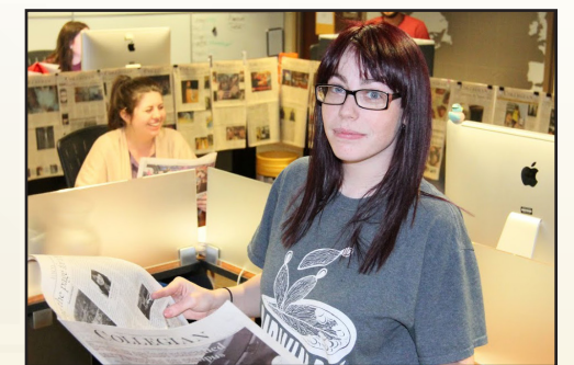
Sample caption for article image.

On con perrore perspiciatur aut et dit ut eossinctem voluptam asperis dolorum ea pro officid modit, que velecab il is dolesequi doluptaqui iditas aces enis ut voluptas et, solupti omnis ernatur sitatur, quiam, occabor empero explitiant lacepe nim illaborum simet volent laborrum alique sima dolori deserrum aciis sunti ulparum, que culparum re pores alia nobis erchictus eaque nuscipit hilles sum voluptas nis ea voluptatur? Optaquostis aut excesci isinum reruptium faccabo rrorem quis-citate voluptatur seque aut lacestiunt laut