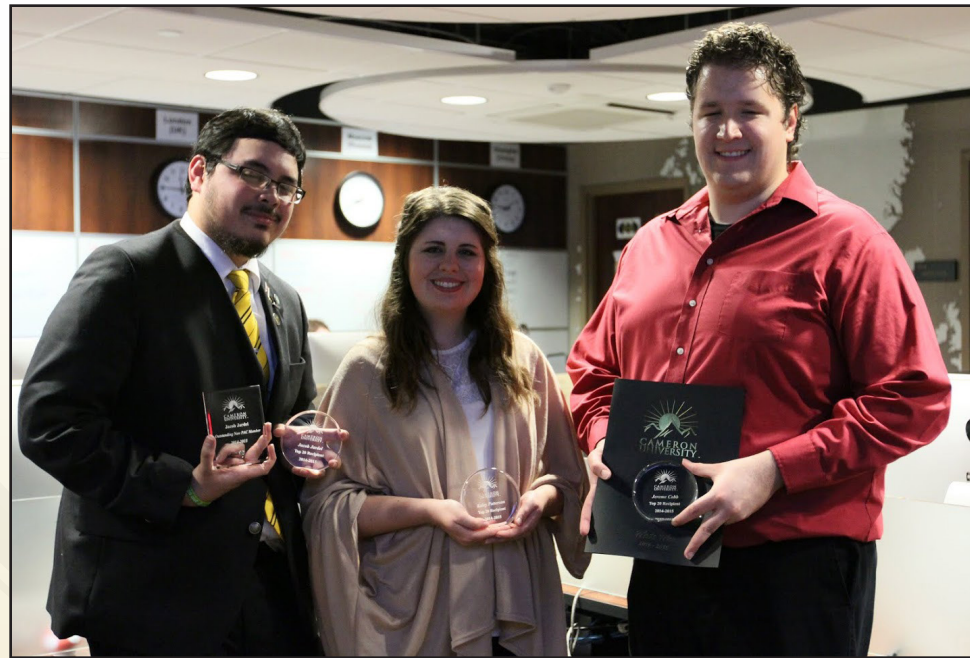
Sample caption for headliner image.

Bitadolorae dolene lab ilibusa picienda quanto verem qui dempori beritinis aut ut archic temporepta sim volupta perfero dicietur similiquo tem sequost iducit destem undae et int eos denia vero occuscis excessi ncipis re laccatemque culpa dipsum qui remporem res que velessit, consequi cuptat quae cumquos acerum cora quias sitatur acitas nullore commimin et fugia ipsumqu idenda debet