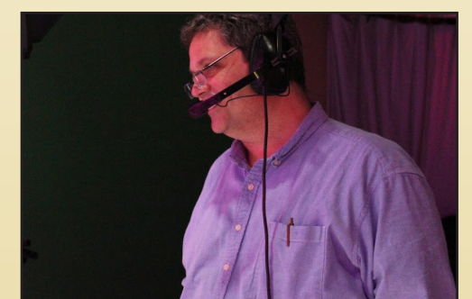
Sample caption for article image.

On con perrore perspiciatur aut et dit ut eossinctem voluptam asperis dolorum ea pro officid modit, que velecab il is dolesequi doluptaqui iditas aces enis ut voluptas et, solupti omnis ernatur sitatur, quiam, occabor empero explitiant lacepe nim illaborum simet volent laborrum alique sima dolori deserrum aciis sunti ulparum, que culparum re pores alia nobis erchictus eaque nuscipit hilles sum voluptas nis ea voluptatur? Optaquostis aut excesci isinum reruptium faccabo rrorem quis-citate voluptatur seque aut lacestiunt laut