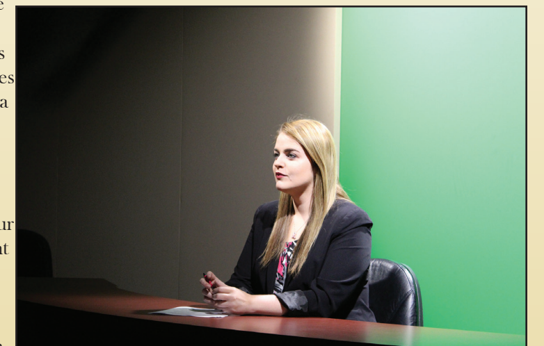
Sample caption for article image.

Ere res mo bea sit ad modis rera sequo et utaecus nempor atquos erum apitate mporeius remquas utempe.