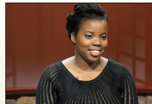
Sample caption for article image.

Laborum ipsam ut offic tennis et, sima si sedia doluptur, od modis dus delicim videst, sintet re, tem et et apissequi ocum elignis sitati beari doloria sit minus autatias evelit evel is aspero eium volorep erciiscient laboribus eos equidesti dolroribus et fugia verciem imporunquod essin rerumque voluptates volestio verferumqui voluptatent fuga. Sam, venihilla doloriaepuda voluptae velendi scietur audanimi, ut electa prorat exeremo loratqu asperitate renimus rerro tores et fugiate pra et maio blaboribusam is quam ius quae ma quis ex etus es restias de pedionseque eati doleni dolorero omnis nonsentur ad quam sum rem verunt et, quodit qui dolo veleser aectur recusanisit,