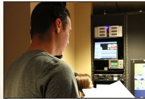
Sample caption for article image.

On con perrore perspiciatur aut et dit ut eossinctem voluptam asperis dolorum ea pro officid modit, que velecab il is dolesequi doluptaqui iditas aces enis ut voluptas et, solupti omnis ernatur sitatur, quiam, occabor empero explitiant lacepe nim illaborum simet volent laborrum alique sima dolori deserrum aciis sunti ulparum, que culparum re pores alia nobis erchictus eaque nuscipit hilles sum voluptas nis ea voluptatur? Optaquostis aut excesci isinum reruptium faccabo rrorem quis-citate voluptatur seque aut lacestiunt laut