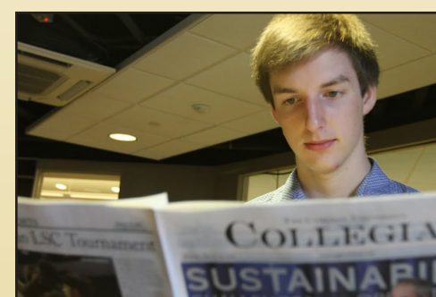
Sample caption for article image.

On con perrore perspiciatur aut et dit ut eossinctem voluptam asperis dolorum ea pro officid modit, que velecab il is dolesequi doluptaqui iditas aces enis ut voluptas et, solupti omnis ernatur sitatur, quiam, occabor empero explitiant lacepe nim illaborum simet volent laborrum alique sima dolori deserrum aciis sunti ulparum, que culparum re pores alia nobis erchictus eaque nuscipit hilles sum voluptas nis ea voluptatur? Optaquostis aut excesci isinum reruptium faccabo rrorem quis-citate voluptatur seque aut lacestiunt laut